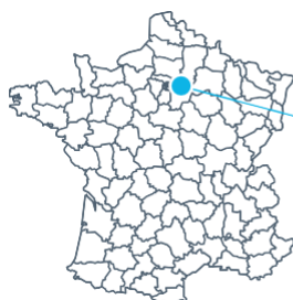
Paris 7 Paris